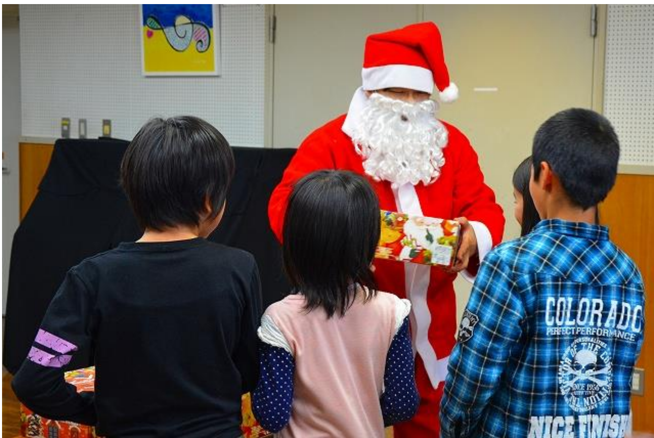
過去の贈呈式の模様（上） と 贈呈したケーキ（下）